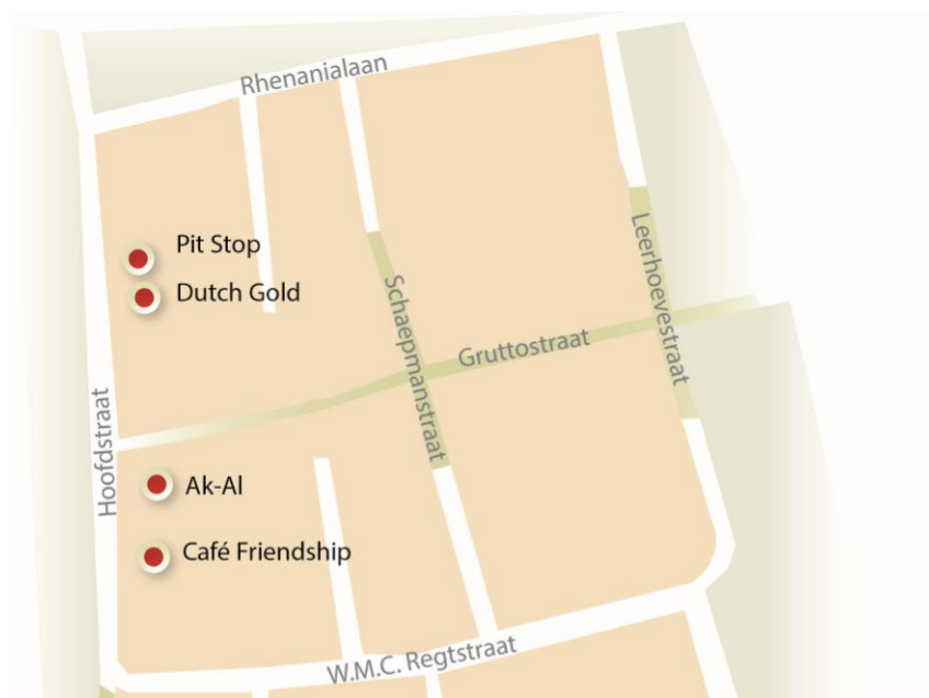
Figuur 1.1: situering coffeeshops Pit Stop en Dutch Gold

In de Hooftstraat zijn restaurants, cafés en detailhandel gevestigd. Voorbeelden hiervan zijn bakkerij/broodjeszaak Ak-AI, café Friendship, een tegenover de coffeeshops gelegen supermarkt en een bouwmarkt. Daarnaast wonen burgers boven en tussen de winkels.