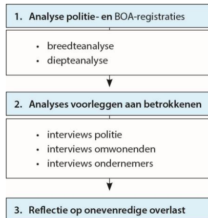
Figuur 1.2: onderzoeksactiviteiten

In figuur 1 staan de twee onderzoeksfasen qua methodologie en de bijbehorende activiteiten. Daarna volgt daarop een nadere toelichting.