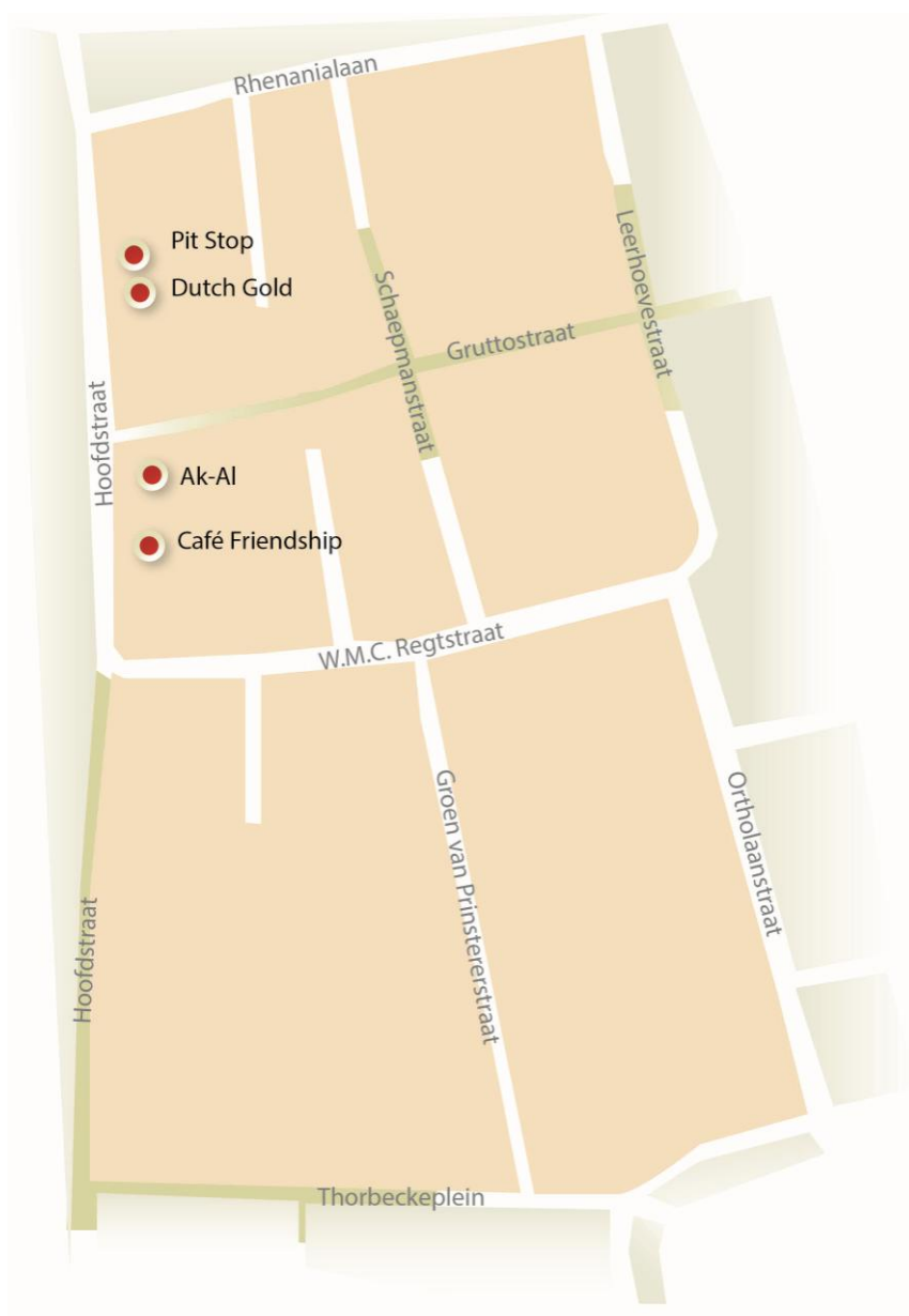
Figuur 2.2: Weergave onderzoeksgebied

In totaal hebben zich in de afgelopen viereneenhalf jaar 215 politie-incidenten voorgedaan in het onderzoeksgebied. Uit tabel 2.6 blijkt dat het aantal incidenten in de jaren 2010, 2011 en 2012 nagenoeg gelijk is gebleven. Vanaf 2013 is er een daling waar te nemen. Van de 215 incidenten doen zich er 158 voor tijdens de openingstijden van de coffeeshops.