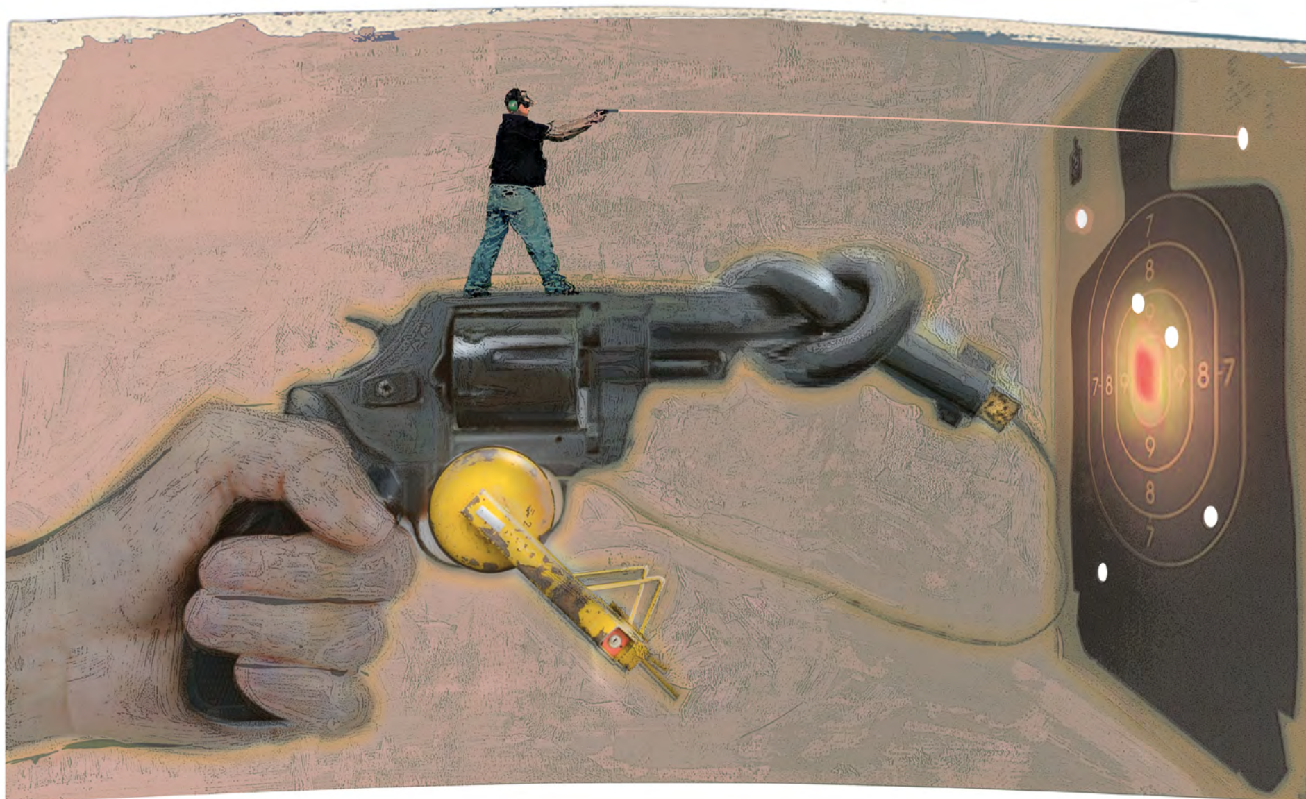
Illustratie: Hans Sprangers

Nederland telt ongeveer 42 000 sportschutters en 28 000 jagers. Samen bezitten zij ruim 168 000 wapens. Sportschutters moeten zich verplicht